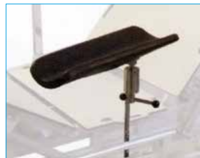
Apoyabrazos ref. MB-TRANSMED-012