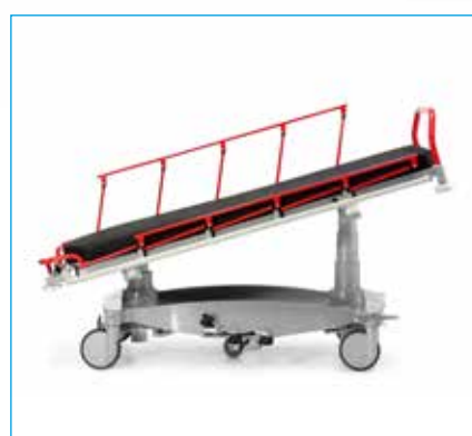
Trendelenburg 16 °