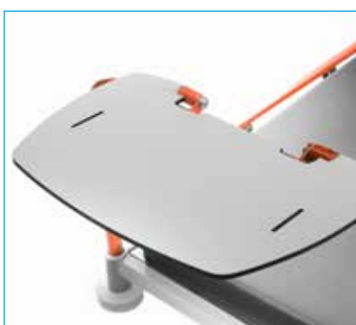
Soporte porta monitor ref. MB-TRANSMED-001