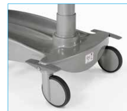
Ruedas de 20 cm de diámetro