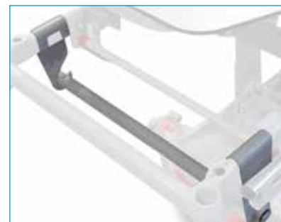
Soporte porta-rollos ref. MB-TRANSMED-014