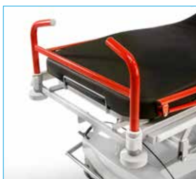
Asas abatibles de traslado ref. MB TRANSMED-056