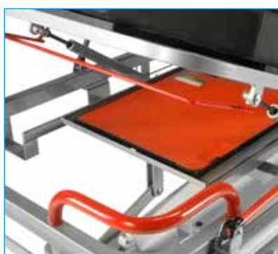
Soporte de placa porta-chasis ref. MB TRANSMED-051