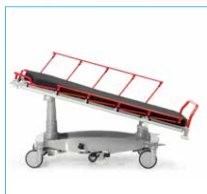
Anti-trendelenburg -16 °